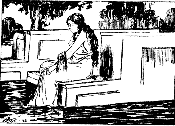
चित्र २—स्नान करना

शरीर पर जो मिट्टी या गर्द लग जाती है वह छूट जाती है। पसीने के द्वारा शरीर से जो गन्दगी बाहर निकलती है वह भी स्नान करने से दूर हो जाती है। इस से मन प्रसन्न रहता है, शरीर में फुर्ती आती है और बल बढ़ता है।